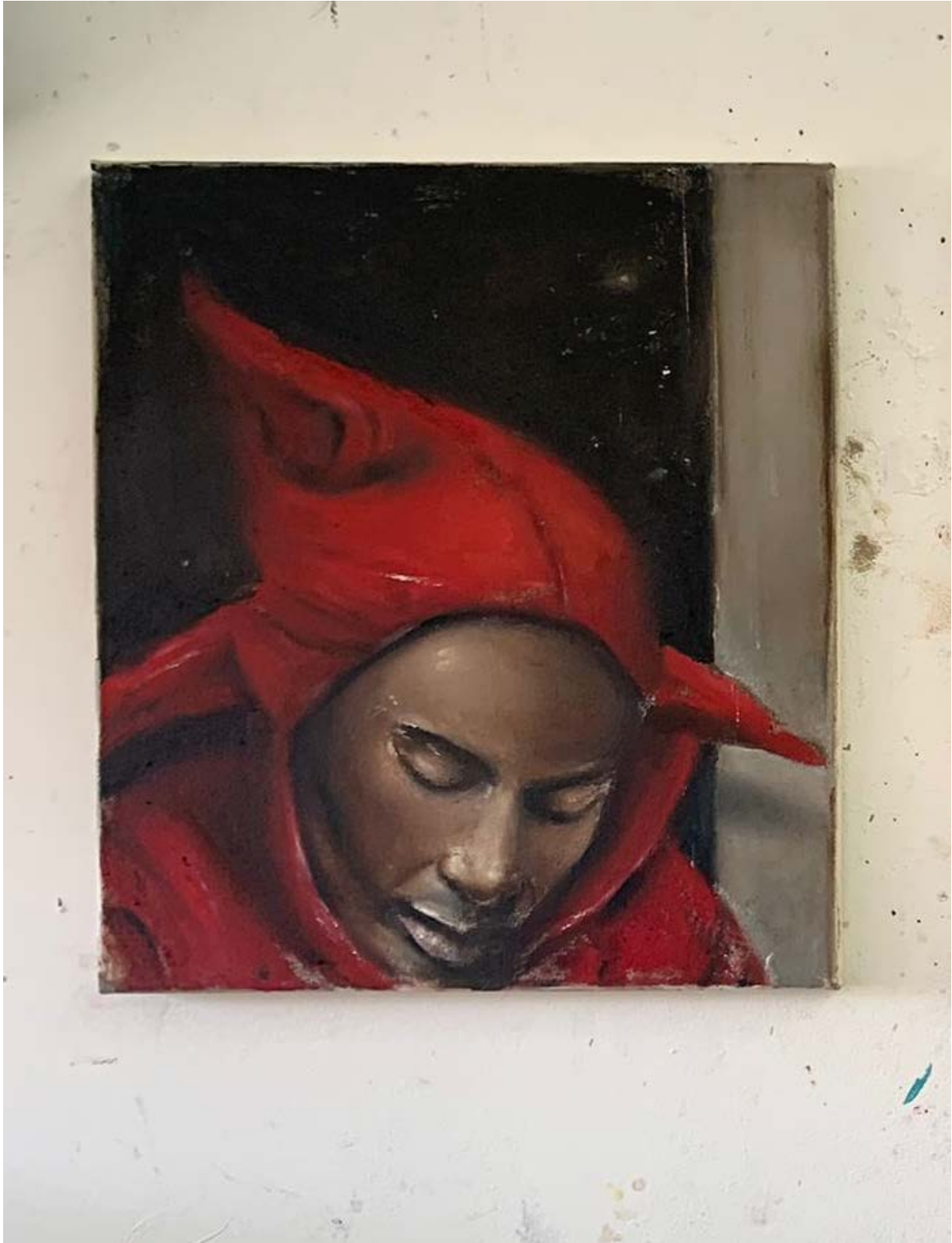
HOOD, 2021 Öl auf Leinwand 45 x40cm Price excl. VAT and Shipping CHF 2'500.00